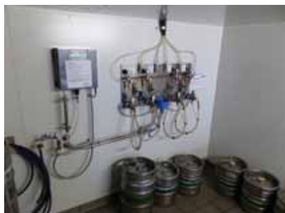
Abb. 9: Automatisches chemisches Reinigungsgerät für Leitungen (Dosiervorrichtung und Steuereinheit)

Beispielhaftes chemisches (Abb. 9) und chemisch-mechanisches Reinigungsgerät (Abb. 10).