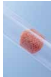
Abb. 12: Gepresste Schwammkugel im Leitungssystem